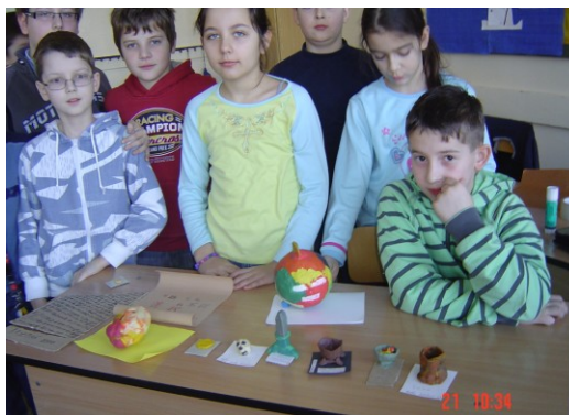
Autori kópií historických prameňov.