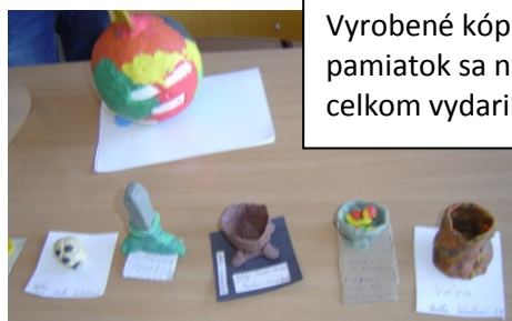
Vyrobené kópie pamiatok sa nám celkom vydarili.