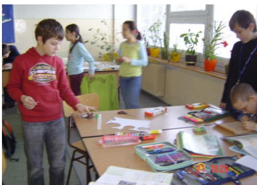
Takto sme si vyrábali kópie historických prameňov – projektová úloha.