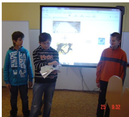
Príprava prezentácie o Olympijských hrách.