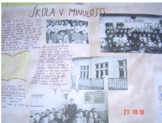
Na internete sme zistili ako vyzerala škola v minulosti a urobili sme poster.