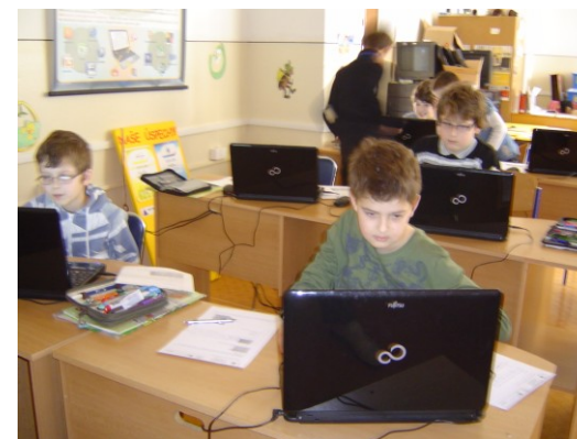
Pracujeme s PC , riešime úlohy z pracovného listu.