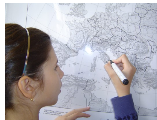
V rámci tohto projektu boli zakúpené aj učebné pomôcky, ktoré sme využili pri práci, napr. veľmi sa páčilo skladanie puzzle o Tutanchamenovi alebo práca so slepou mapou.